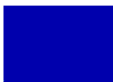
PANTONE REFLEX BLUE